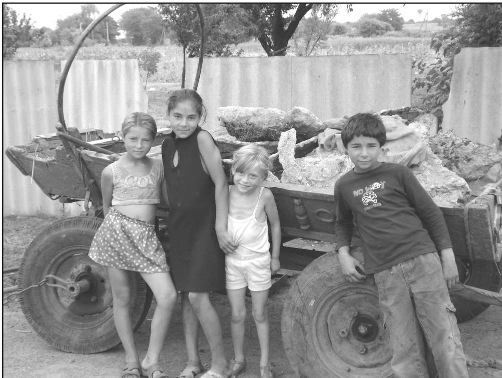
Діти біля підводи з металобрухтом, Піщанко, Дніпропетровська область, серпень 2006.