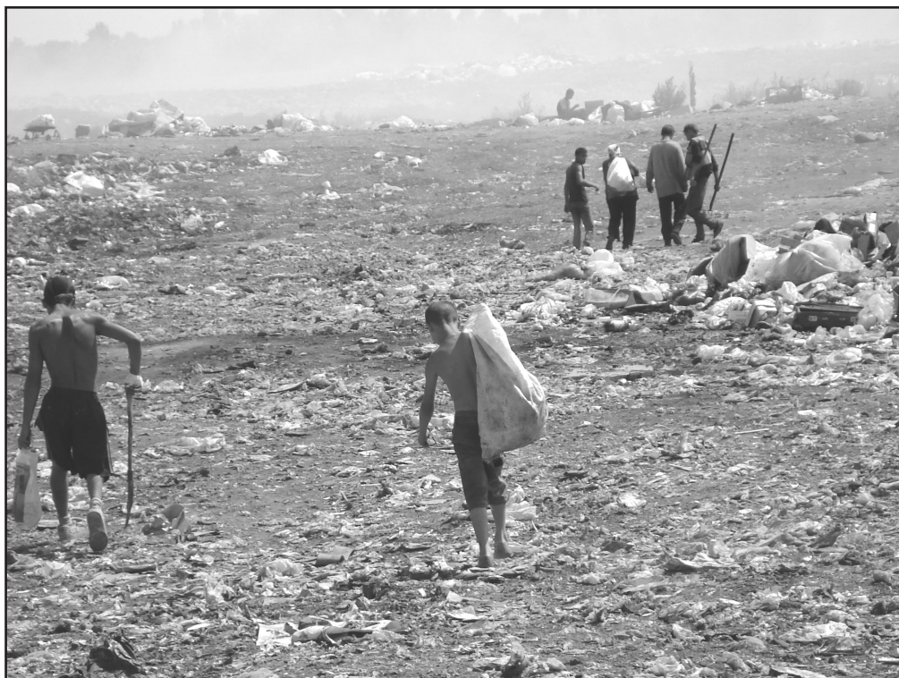
Збирачі металобрухту і скла на Новомосковському міському звалищі, серпень 2006 року.