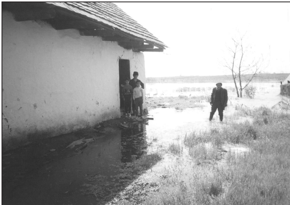
Роми у селі Ясени, Ужгородський район, Західна Україна.