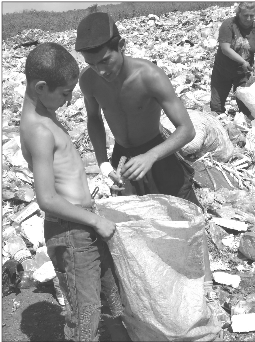
Ромські хлопці збирають металобрухт і скло на міському звалищі м.Новомосковськ.